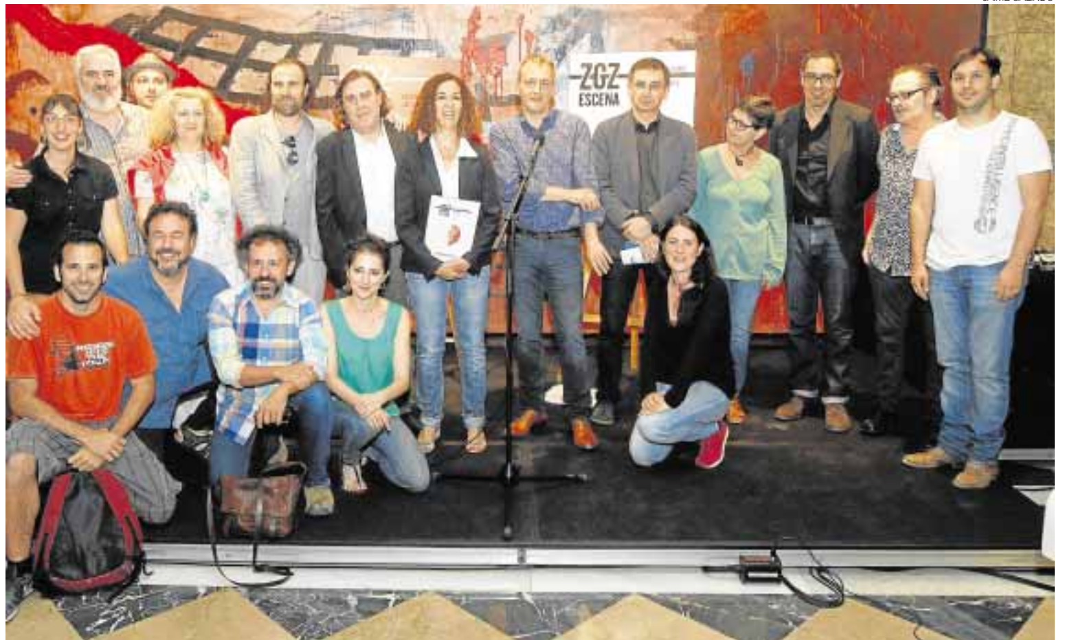
► La puesta de largo de este festival se produjo ayer en el Teatro Principal al que asistieron organizadores y participantes del proyecto.