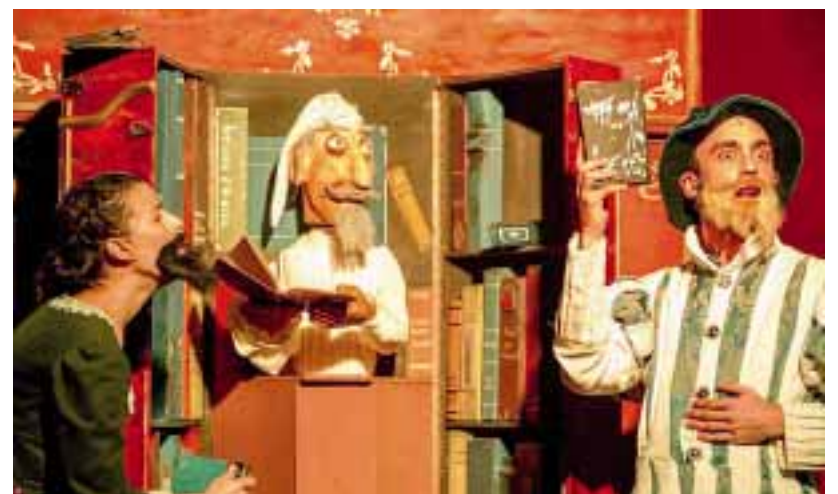
►► 'Ingenioso hidalgo', de Producciones Viridiana se verá también en el festival.

mour , de Marie de Jongh en lo que respecta al teatro.